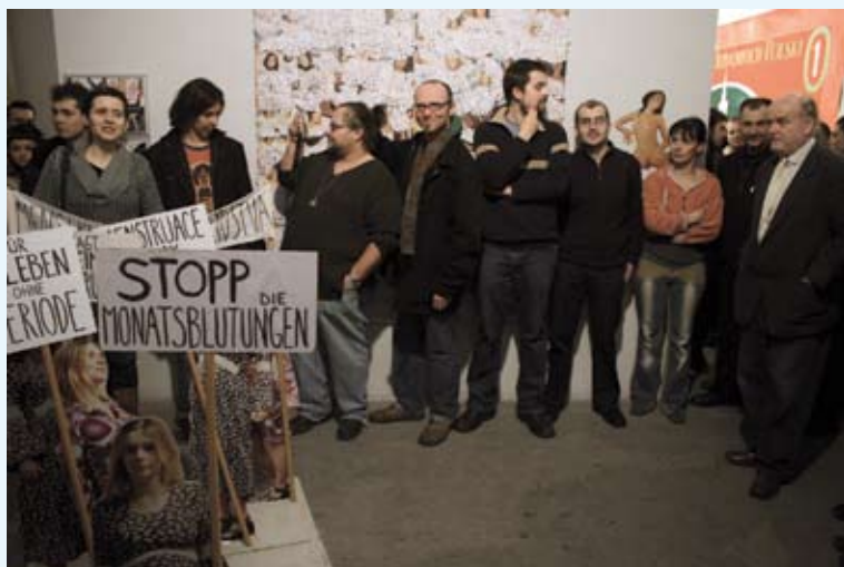
Wernisaż. W tle prace Lenki Klodovej