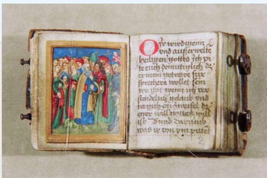
Modlitewnik księżnej Elżbiety Lukrecji- orszak świętych, miniatura