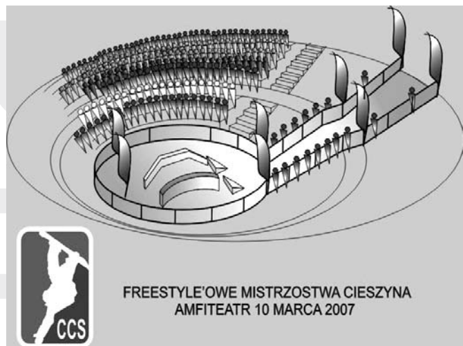
FREESTYLE'OWE MISTRZOSTWA CIESZYNA AMFITEATR 10 MARCA 2007

Cieszyńskie Centrum Snowboardu „CCS”, Stowarzyszenie Promocji i Rozwoju Sportów Ekstremalnych „TROTYL” oraz MOSiR zapraszają 10 marca do cieszyńskiego amfiteatru na zawody SNOWBOARDOWE w konkurencji „jibbing”. Amfiteatr zamieni się w śnieżną arenę, na której na dwóch specjalnie na tą okazję przygotowanych przeszkodach – „boxach”, zostaną rozegrane Freestyleowe Mistrzostwa Cieszyna. Zapraszamy wszystkich do uczestniczenia, a także do kibicowania śmiałkom, którzy będą walczyć o tytuł Mistrza Cieszyna w Snowboardzie oraz Freeskiingu. Na najlepszych czekają puchary oraz cenne nagrody! Zawody odbędą się przy dźwiękach muzyki (dj Milk) oraz przy sztucznym oświetleniu.