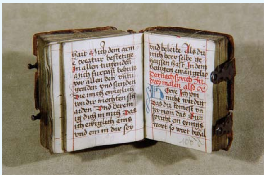
Modlitewnik księżnej Elżbiety Lukrecji