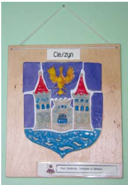
Herb Cieszyna wykonany przez Ewę Warlewską

Od połowy stycznia 2007 roku w cieszyńskim Ratuszu (1. piętro, obok gabinetu burmistrza) można zobaczyć wystawę pt. „HERBY GMIN POWIATU CIESZYŃSKIEGO”.